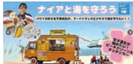
▲(千葉県・高2) <兵庫県・高1>

受講生達が自分で考えたビジネスの資金調達の結果は合計1,000万円以上、約1,500人もの支援者を集め、応援される起業家としてスタートを切っています。