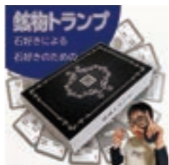
▲愛知県・小6が制作販売の『駄物トランプ』