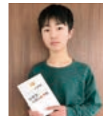
▲広島県・小6が書籍を出版!